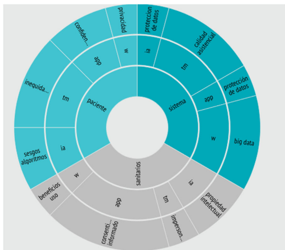
Figura 2 Desafíos éticos en salud digital. Se exploran los desafíos éticos de la IA, la TM, las App móviles (app), los wearables y la IoT (W), desde las perspectivas del sistema de salud (sistema), profesionales de la salud (sanitarios) y personas usuarias (pacientes).